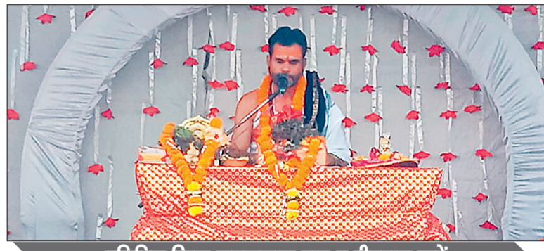
प्रतिदिन विष्णु सहस्रनाम पाठ व दीपदान करें

उन्होंने कहा कि मानव की अभिलाषा असीमित है। जो वस्तु हमारे पास नहीं है, जीव उसकी अभिलाषा करता है। उसकी प्राप्ति के बाद भी जीव संतुष्ट नहीं होता, उससे अधिक की चाह रखता है, जिससे जीव सुखी व आनंद से नहीं रह सकता। भागवत कथा ही एक मात्र साधन है, जो जीव को संतुष्टि एवं आनंद की अनुभूति कराती है। उन्होंने कहा कि हम भगवान