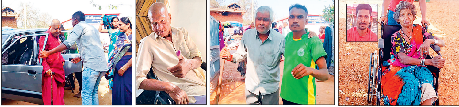
बालोद। त्रिस्तरीय पंचायत चुनाव के तहत ब्लाक के विभिन्न ग्रामों में मतदान को लेकर युवाओं से लेकर बुजुर्गों तक सबने उत्साह पूर्वक मतदान किया। मतदान के बाद सोशल मीडिया में अपने मतदान के निशान को दिखाते हुए फोटो शेयर किया।